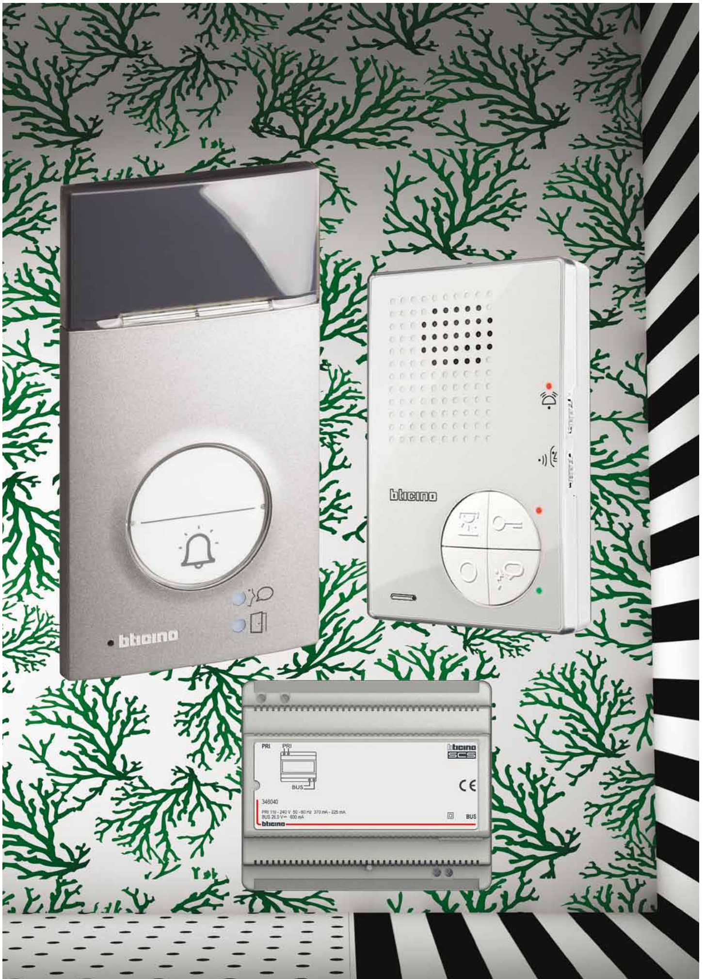
Kit A1 Serie 120 met T-40