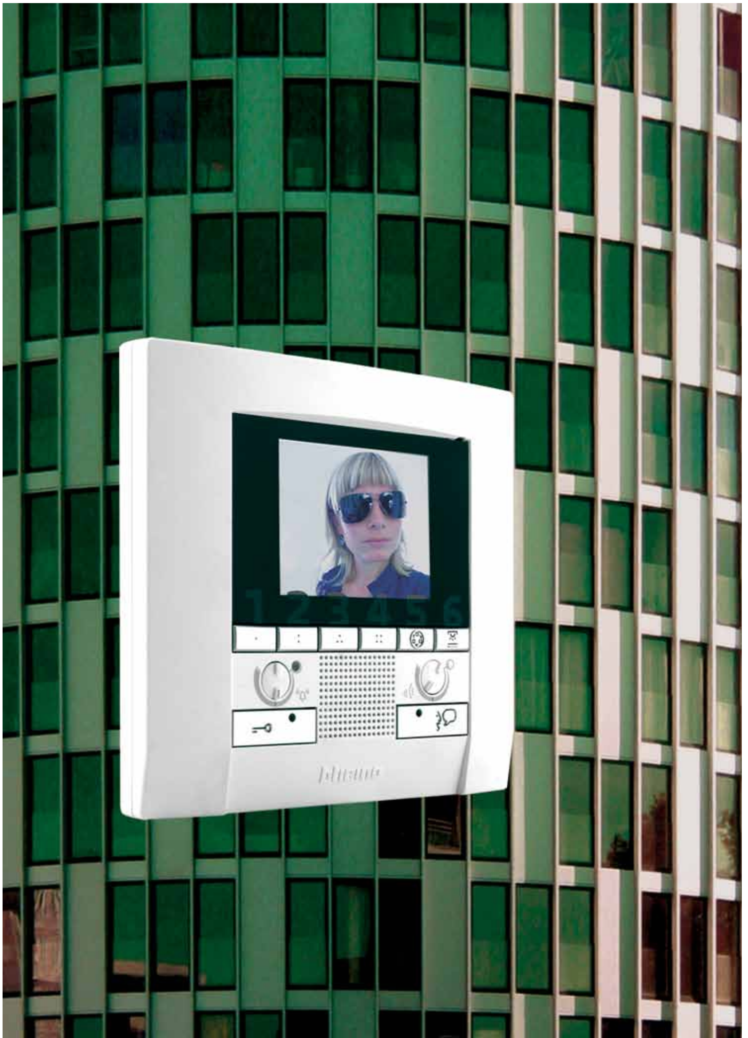
M-20 Videofoon Kijkduin