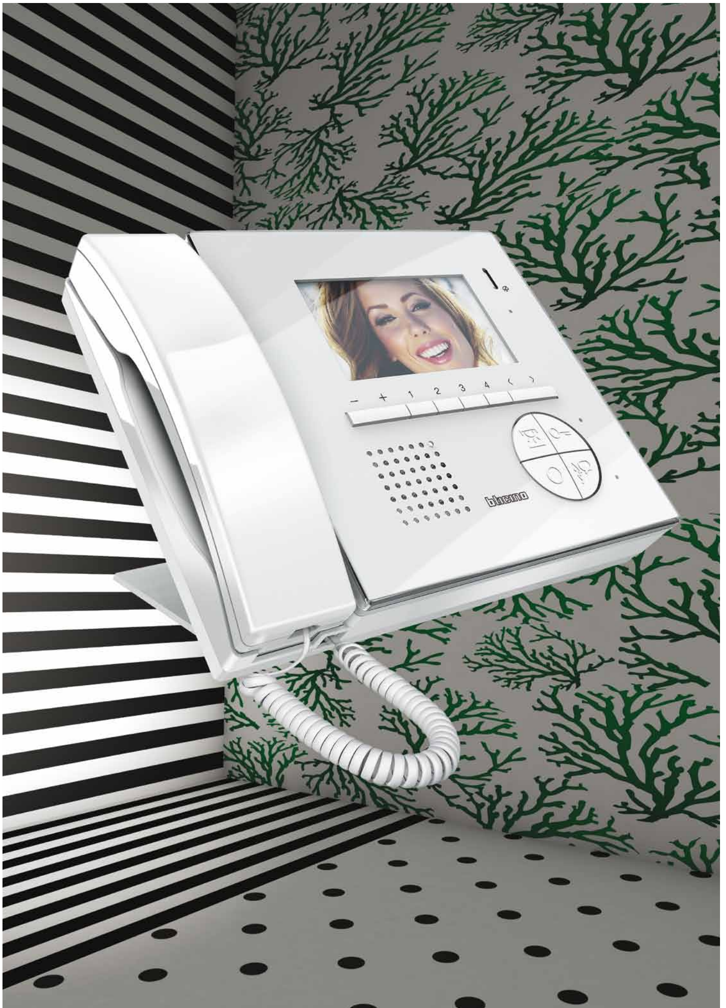
Videofoon M-43T Domburg