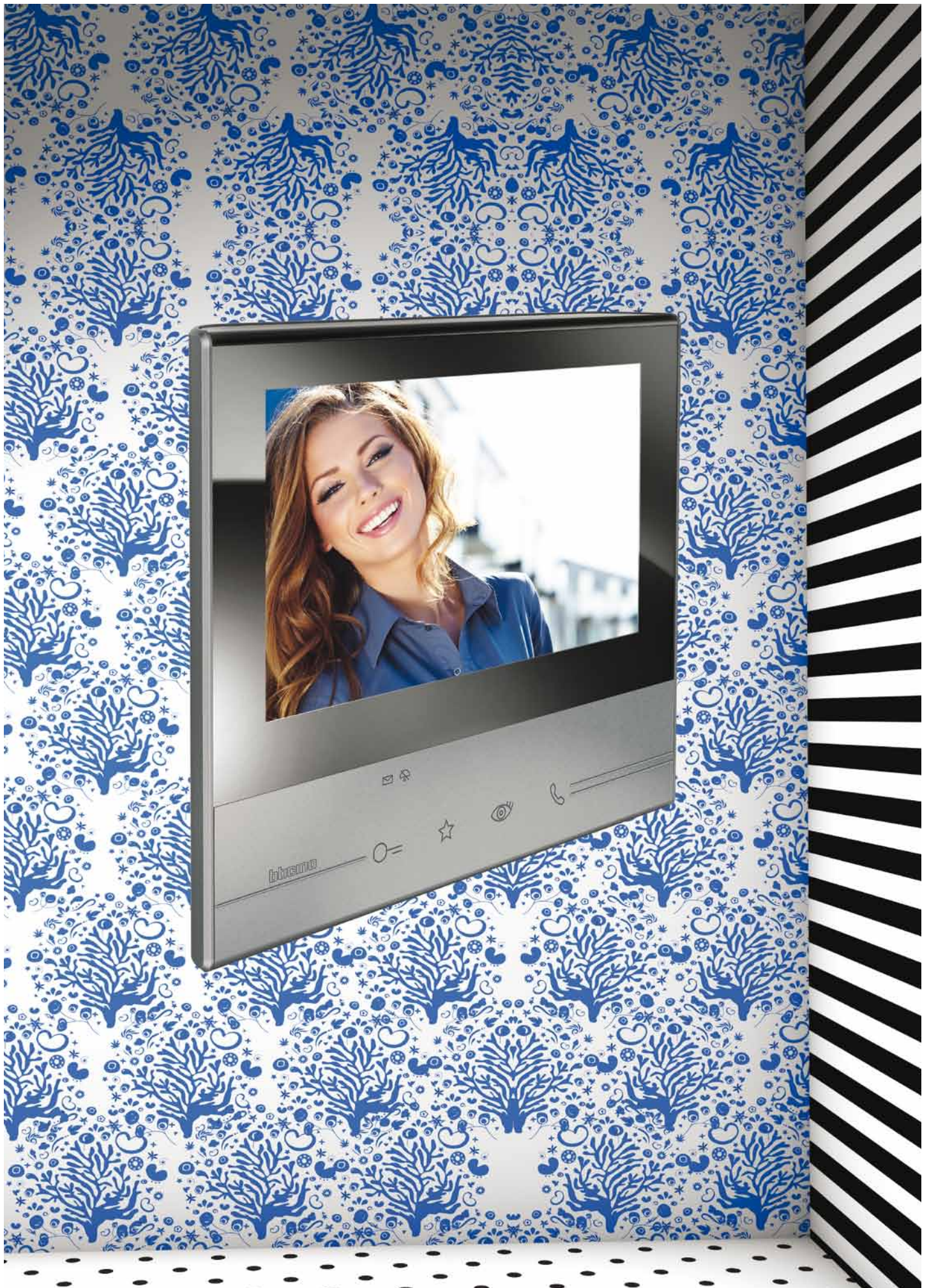
Videofoon M-70 Bloemendaal