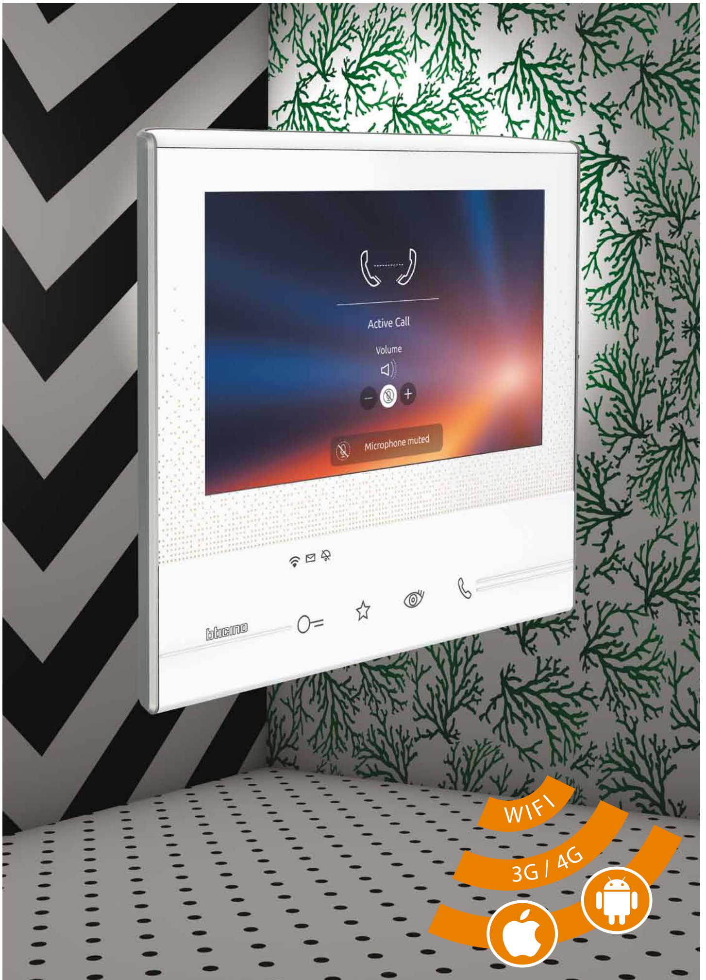
Videofoon M-70Wifi Bloemendaal