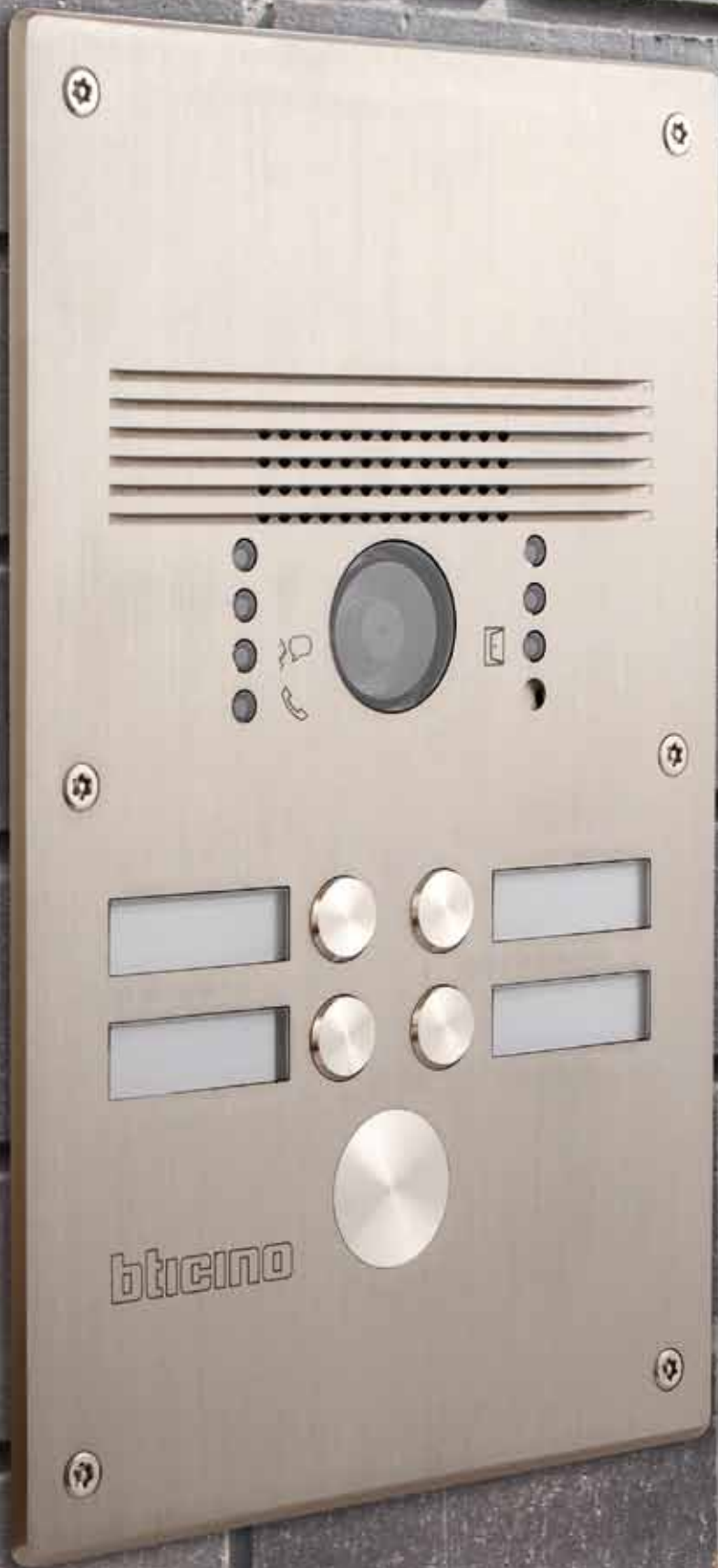
Serie 81 met 4 drukkers