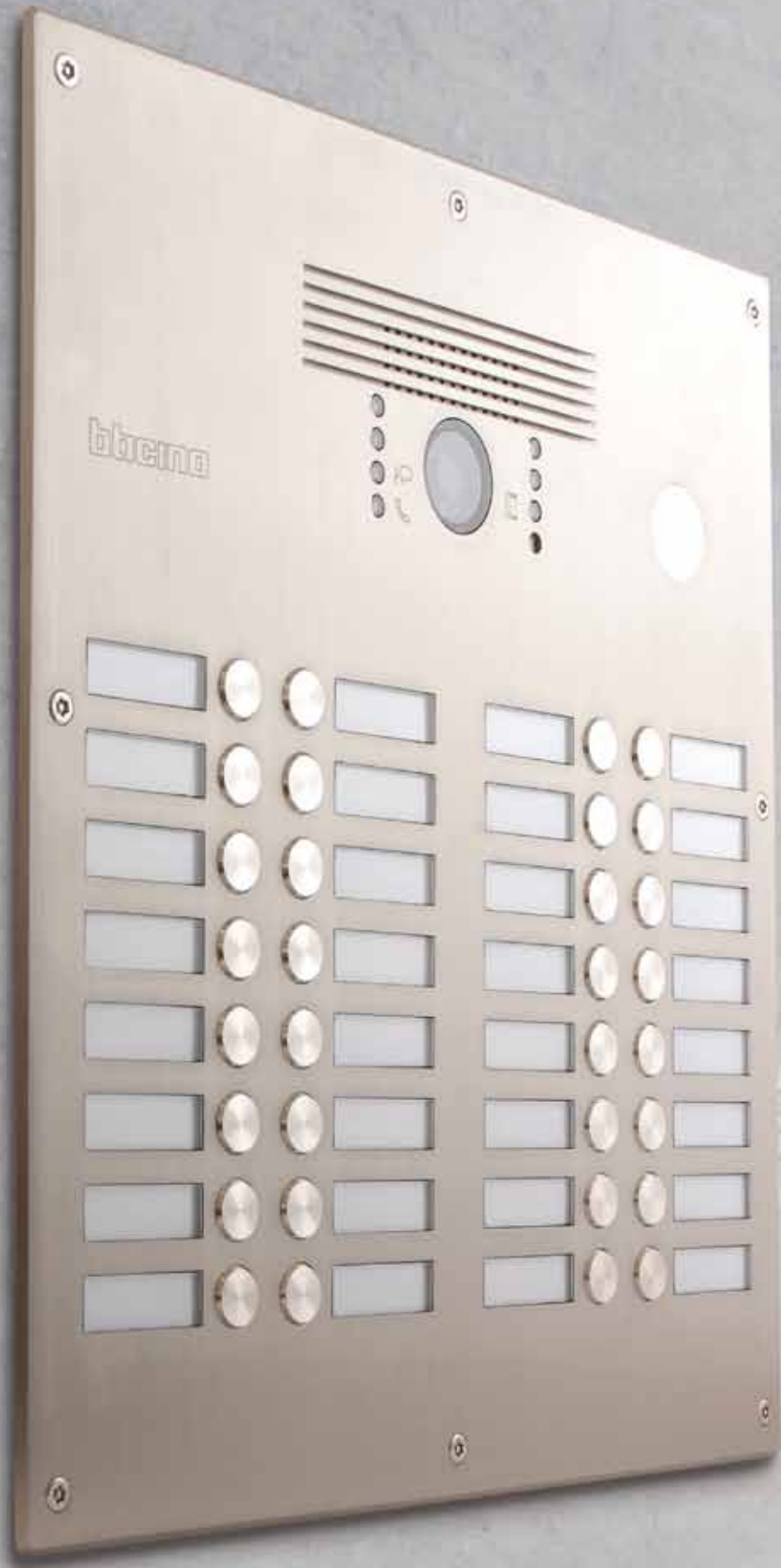
Serie 81 met 32 drukkers