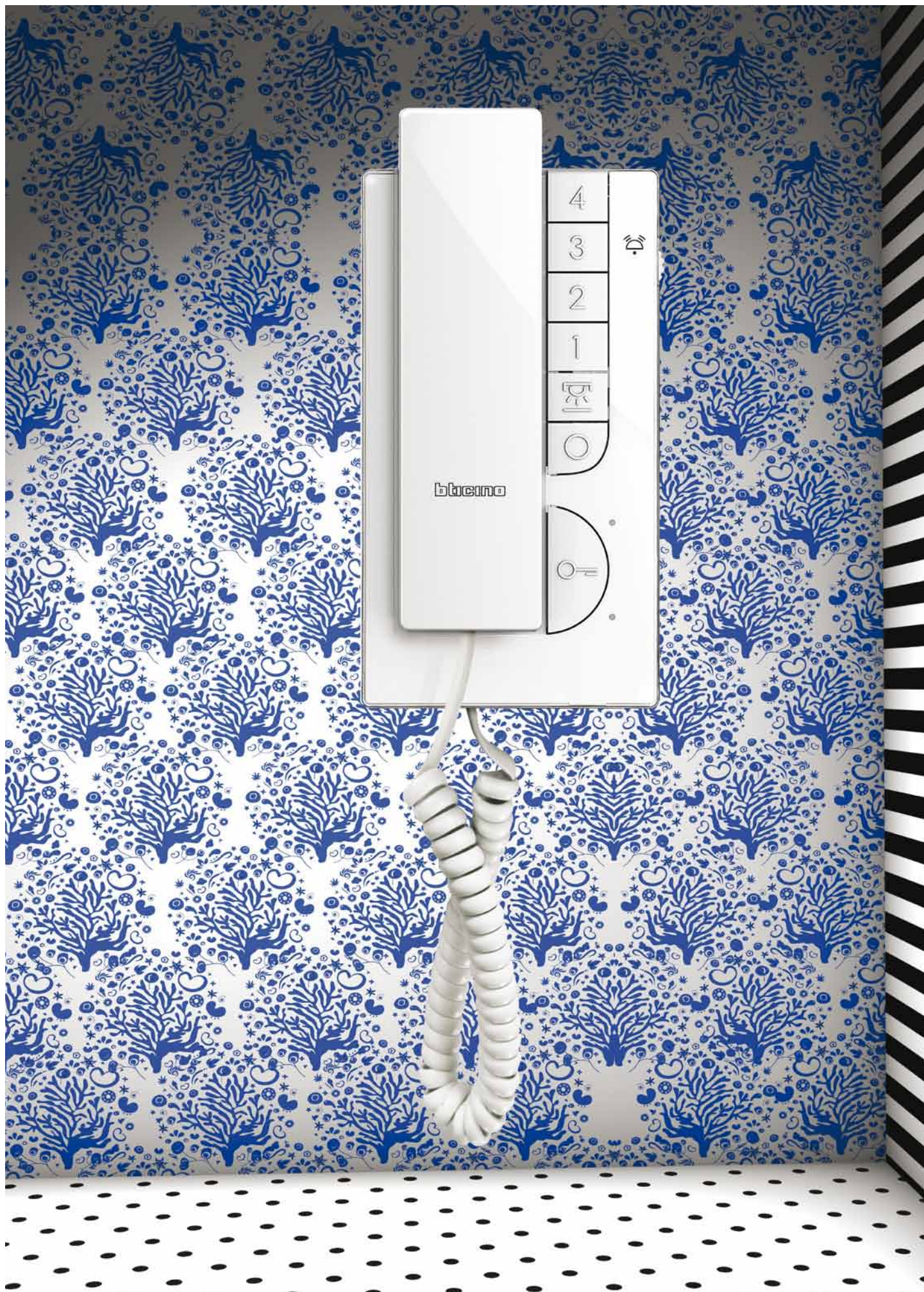
Deurtelefoon T-50 Egmond