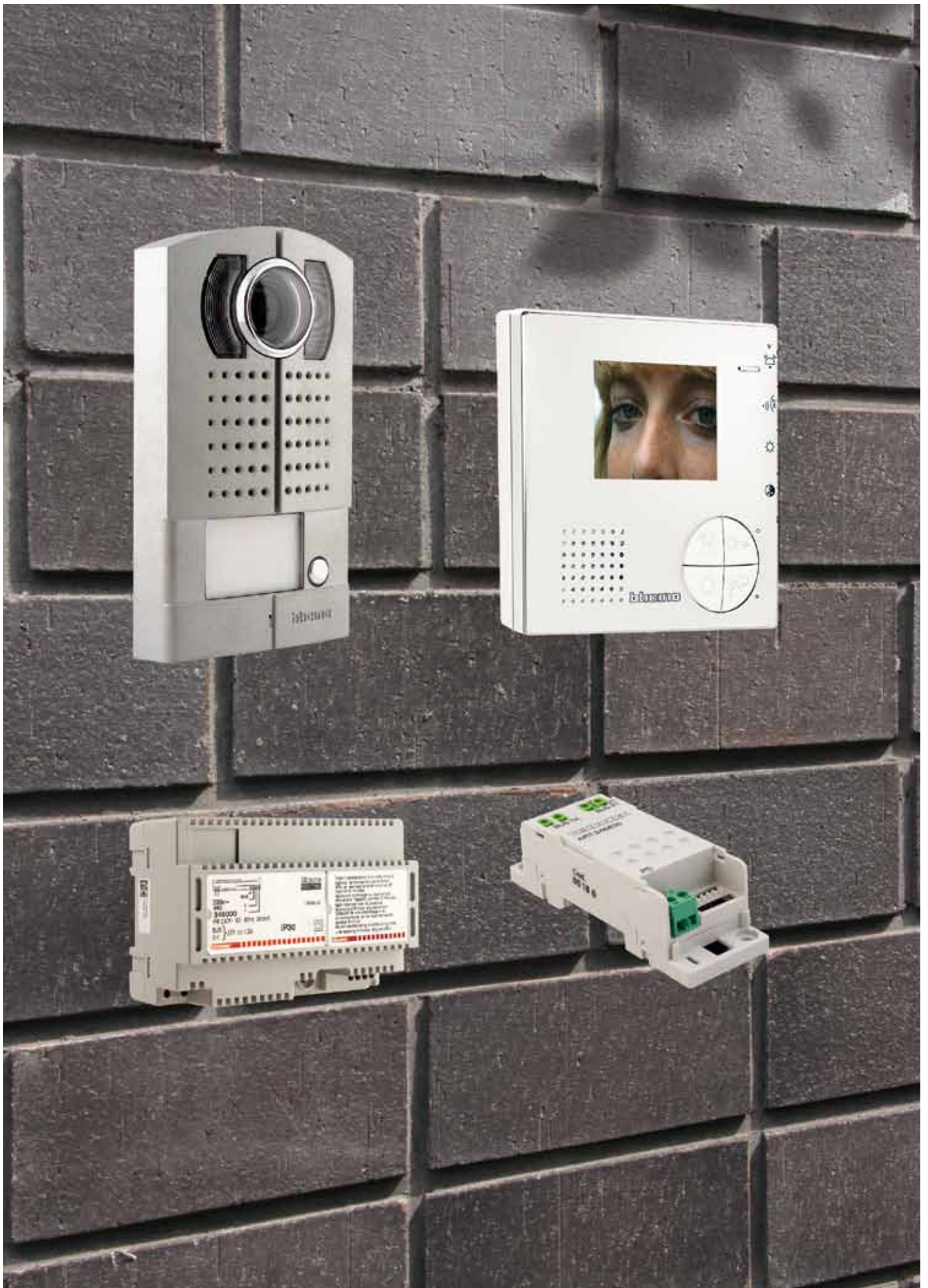
Kit V1 S-20 opbouw met M-40