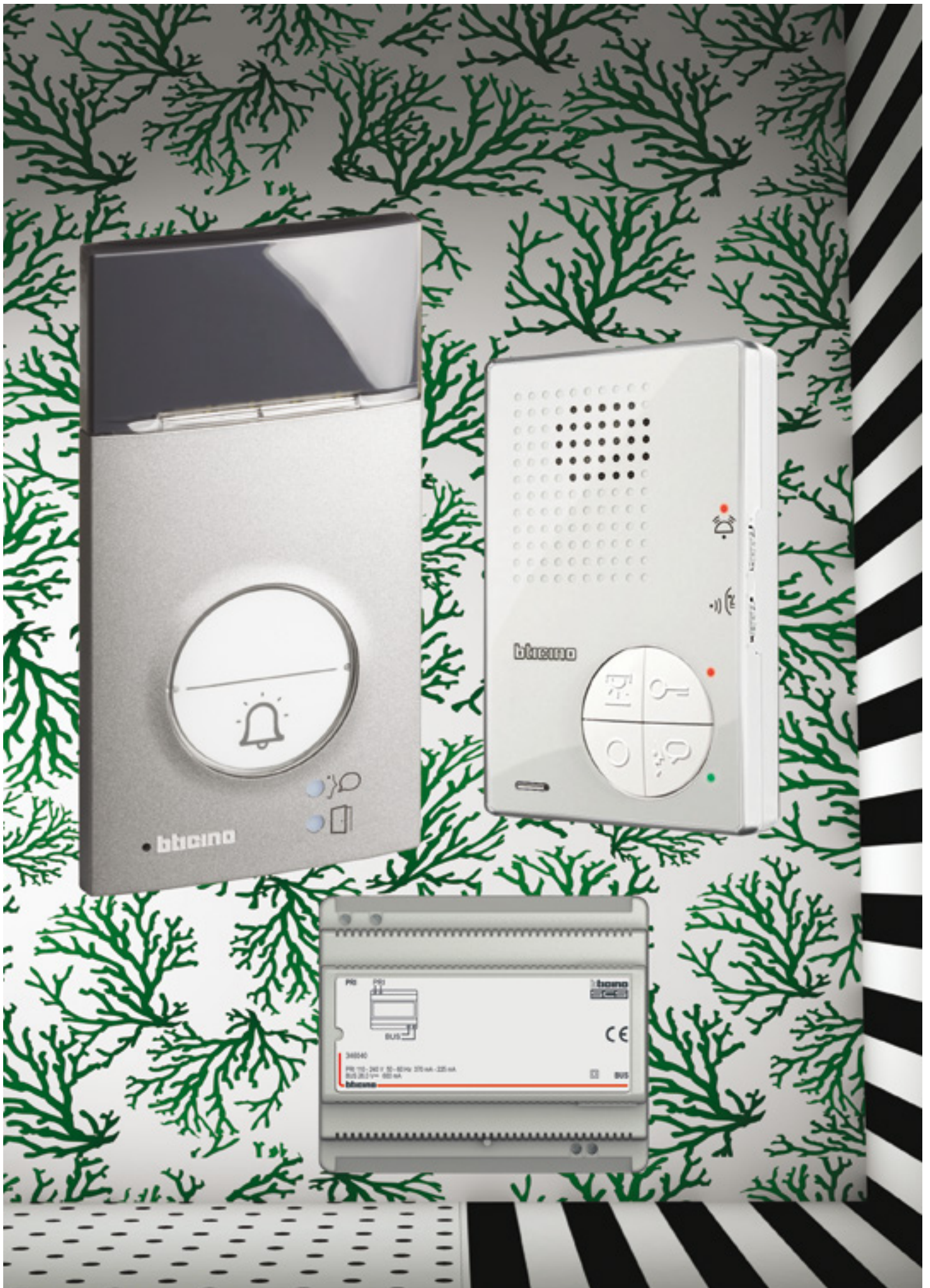
Kit A1 Serie 120 met T-40