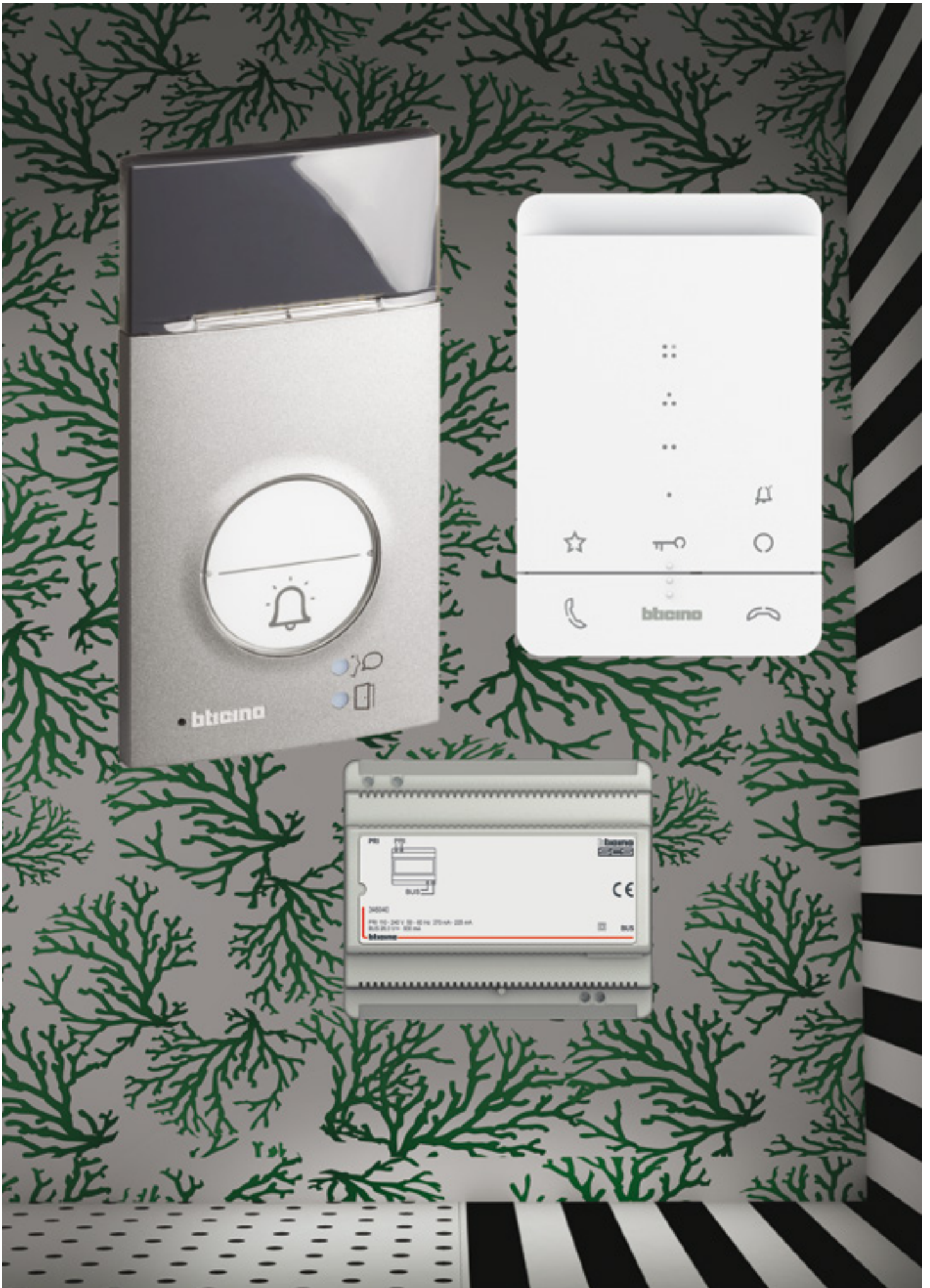
Kit A1 Serie 120 met T-55