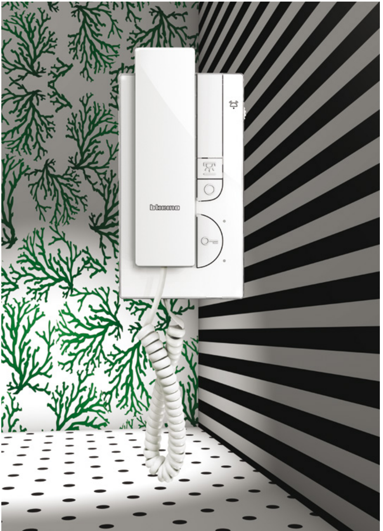
Deurtelefoon T-45 Renesse