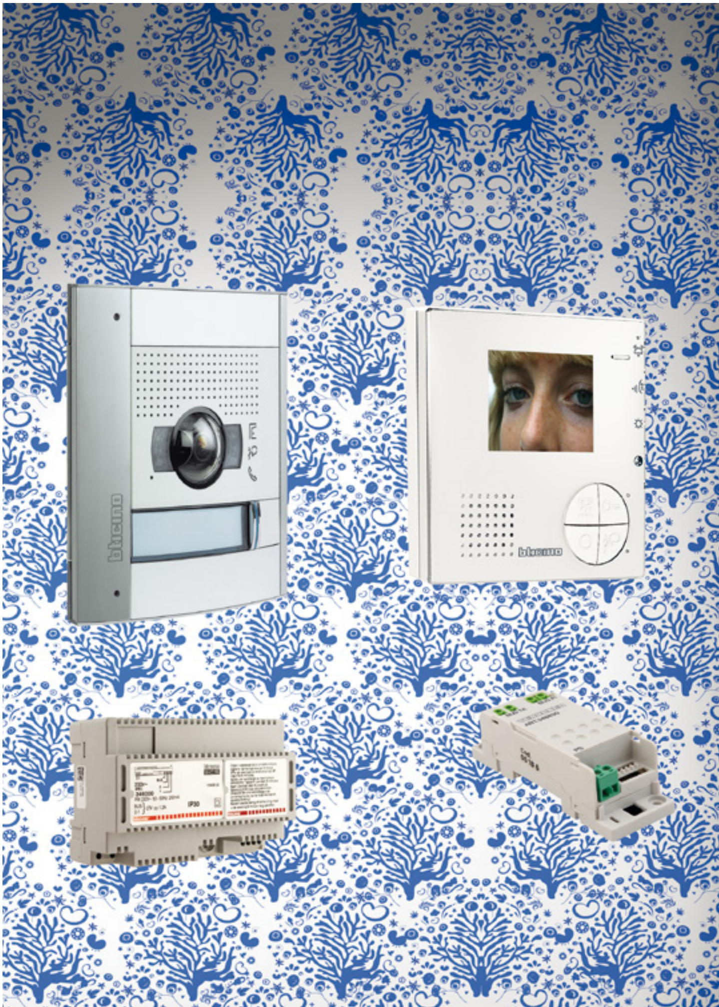
Kit V1 S-131 color met M-40