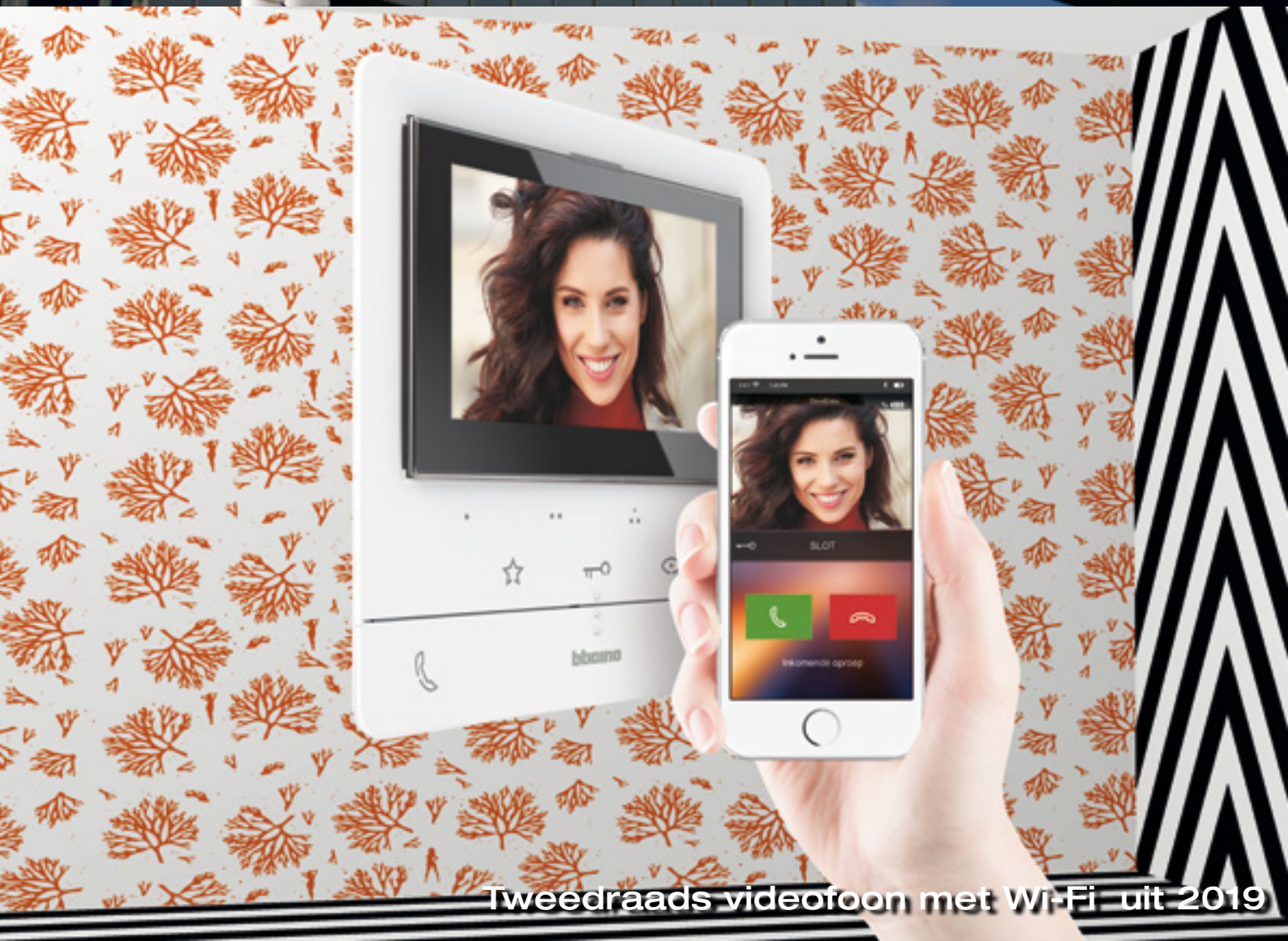
Tweedraads videofoon met Wi-Fi uit 2019