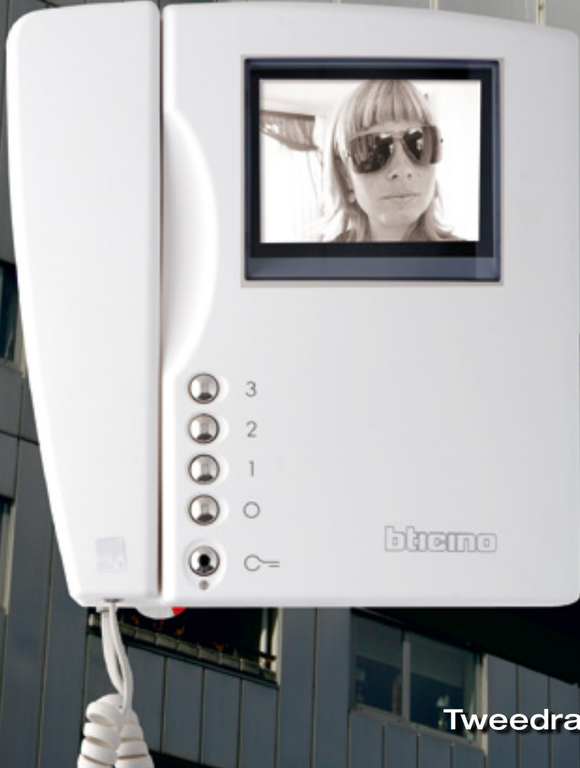
Tweedraads videofoon uit 2008